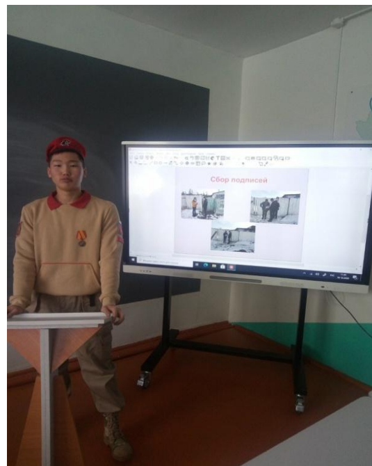
Защита проекта на слете СФО «Молодые патриоты – сила Сибири»