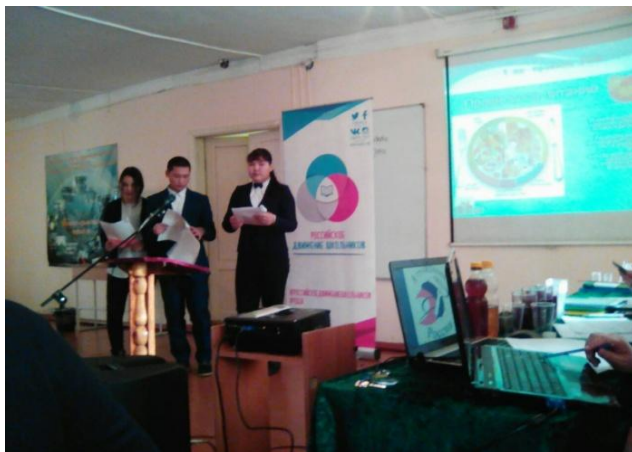
Защита проекта на республиканском конкурсе «Я гражданин России»