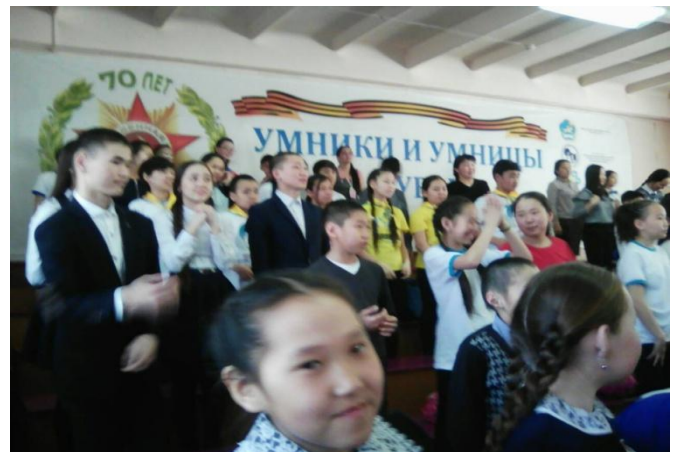
На республиканском конкурсе «Лидер 21 века»