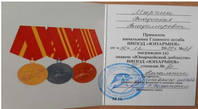
Знак юнармейской доблести 3 степени