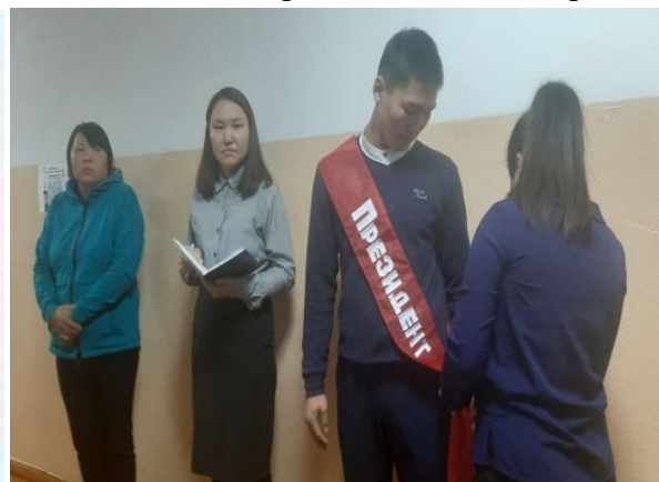
Президент школы - 2020