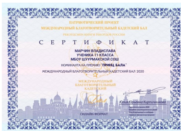
Сертификат участника Международного Кадетского бала - 2020