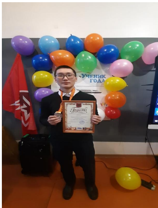
Конкурс «Ученик года-2022»