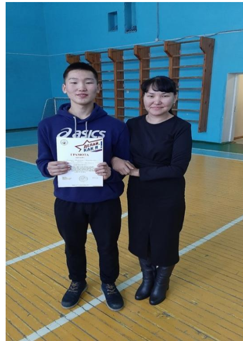
призер регионального конкурса «Делай, как я»