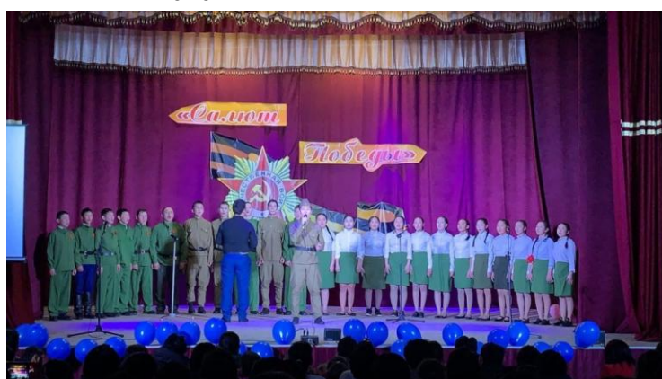
Солист хорового коллектива на фестивале «Салют Победы»