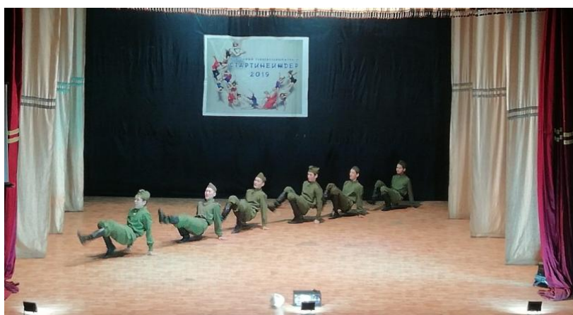
На танцевальном конкурсе