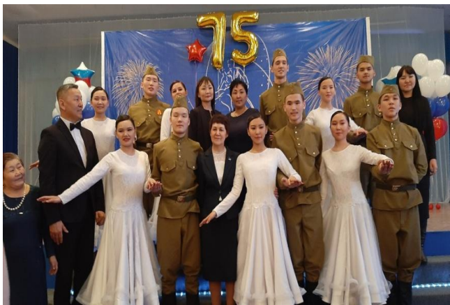
Победители республиканского кадетского бала «Виват, кадет»