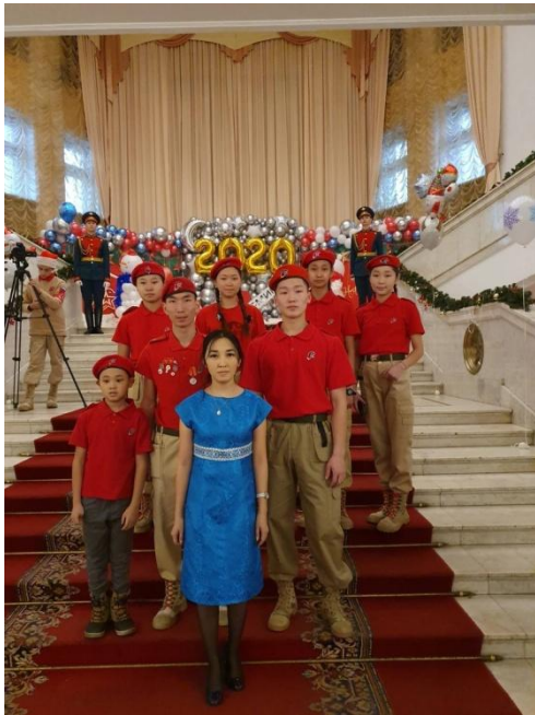
на Всероссийском юнармейском новогоднем представлении в Москве