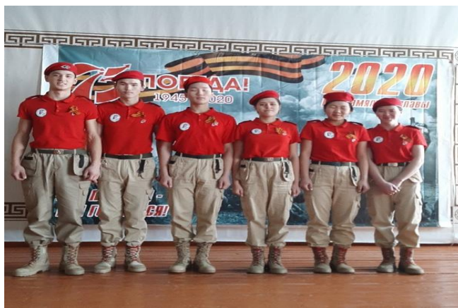
Юнармейские соревнования «Один день в армии»